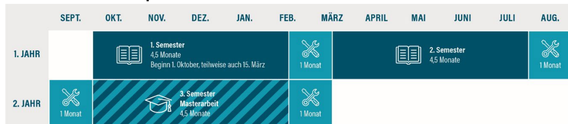
Abbildung 1: Zeitliche Organisation der Praxisphasen - Beginn Wintersemester